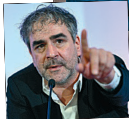
Der linksradikale Journalist Deniz Yücel verachtet die Deutschen – aber liebt die Bundesregierung und ihre Medien. Dafür boxten sie ihn aus türkischer Haft raus.