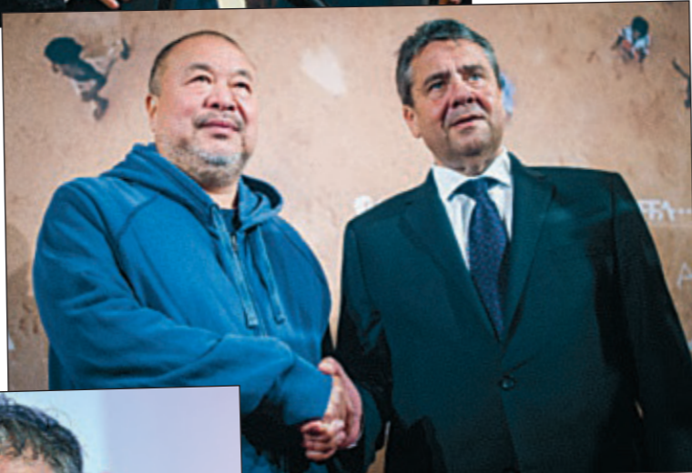
Der Chinese Ai Weiwei – hier mit Ex-Außenminister Gabriel (SPD) – erhielt von Merkel nach der Befreiung Asyl in Deutschland.