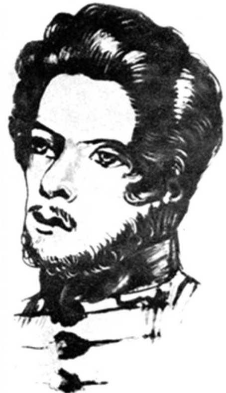
Zeichnung des jungen Marx

Durch rastlose Aktivitäten und anonyme Publikationen versuchte Bruno Bauer dem üblichen Schicksal des Dissidenten zu entgehen, ohne angemessene Stellung, ohne ausreichende Einkünfte und von allen Freunden verlassen und verraten in der Bedeutungslosigkeit zu enden. Weil man einen bisher von Regierung und Universität gut angesehenen jungen Mann nicht ohne Umstände erledigen kann, erhielt Bruno Bauer zuerst noch einen Lehrauftrag als Dozent in Bonn. Marx folgte Bruno Bauer nach Bonn, angeblich um dort an dem für Bruno Bauer noch erhofften Lehrstuhl selber wissenschaftlich zu arbeiten. Im März 1842 wurde Bruno Bauer schließlich von der Regierung abgesetzt und erhielt sein Lehrverbot.