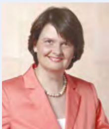
Maria Flachsbarth MdB, Präsidentin KDFB

als katholischer Frauenverband können wir bei unserem gesellschaftlichen, politischen und kirchlichen Engagement die Querschnittsaufgabe Gender Mainstreaming und die Kategorie Gender nicht ausklammern. Dieser Aufgabe haben sich schon unsere Gründerinnen und Vorgängerinnen gestellt, auch wenn sie es noch nicht so nannten. Das tun KDFB-Frauen heute, wenn sie geschlechtsbezogene Ungerechtigkeiten in Gesellschaft, Wirtschaft und Kirche erkennen und sich für Veränderungen einsetzen. Es gibt keine geschlechtsneutrale Wirklichkeit: Mädchen und Jungen lernen anders, Erwerbsbiographien, Arbeitslöhne und Renten von Frauen und Männern unterscheiden sich, Gesundheits- und Suchtprävention sind geschlechtsspezifisch wirksamer, ehren- und hauptamtliche Arbeit in Gesellschaft und Kirche werden in unterschiedlicher Weise von Frauen und Männern geleistet.